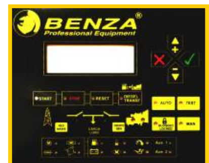
Fig.2 Controlerul digital al panoului de transfer sarcina