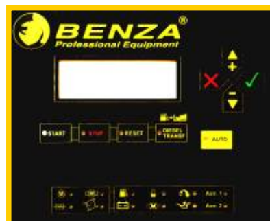
Fig.1 Controlerul digital al generatorului de curent